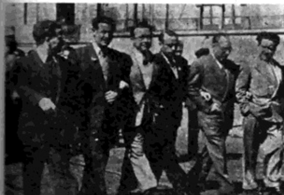
Manifestación del 1.º de mayo de 1946 celebrada en Toulouse. (De izquierda a derecha, F. Claudin, J. Modesto, S. Carrillo, F. Antón, J. Comorera y A. Mije.)