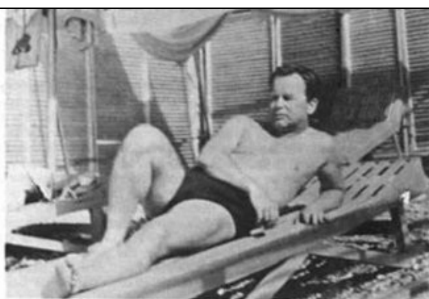
La llegada de Fernando Claudín a París en enero de 1955 refuerza de manera notable las posiciones de Santiago Carrillo en el Buró Político. (En la foto, F. Claudín durante unas vacaciones en Crimea.)