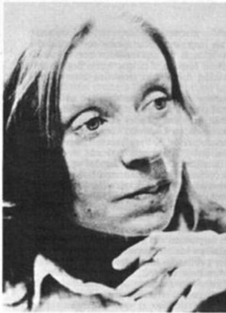
Fumadora insaciable, Pilar Brabo había tomado de los italianos, y concretamente de Berlinguer, el lema según el cual para la política lo fundamental es tener un culo de hierro y aguantar las reuniones sin cansarse.