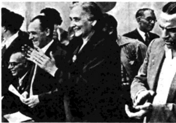
Uribe llegó a París en mayo del 46 para ocupar el segundo lugar en el escalafón jerárquico del PCE que le correspondía desde la expulsión de Jesús Hernández en 1944. Carecía de la ductilidad política de Dolores y de la capacidad de Carrillo. (En la foto, de izquierda a derecha, J. Comorera, V. Uribe D. Ibárruri y F. Antón durante un mitin en Toulouse, julio de 1947.)