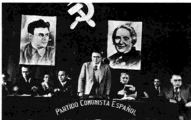
Pleno del CC del PCE, celebrado en Toulouse en 1945. De izquierda a derecha, E. Lister, F. Antón, S. Carrillo, D. Ibárruri y J. Comorera.