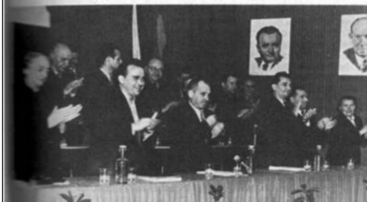
El V Congreso del PCE (1954) había situado como indiscutible número dos a Vicente Uribe. Carrillo por un lado y Uribe por otro se preparaban a una lucha de posiciones. Faltaba la chispa que provocara la guerra sin cuartel. De momento y hasta 1956, durante casi dos años, será el interregno. (En la foto, presiden dicho acto, de izquierda a derecha, S. Carrillo y V. Uribe.)

Lo más llamativo del V Congreso es la presencia de hombres que conocen la clandestinidad, que pasan parte de su tiempo en el interior y que, con su sola presencia, representaban el mayor triunfo de Carrillo y su aparato. (En la foto, los asistentes al V Congreso cantan la «Internacional»; delante a la derecha, se reconoce a S. Sánchez Montero y J. Semprún.)