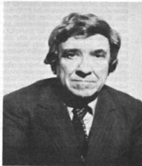
El secretario general del PCE cruzó la frontera española, clandestinamente, el 7 de febrero de 1976. Lo hacía por primera vez desde que a comienzos del año 39 abandonara el país. (Foto de Santiago Carrillo de su pasaporte falso, el último que realizó Domingo Malagón.)

Sin una reflexión sobre la figura de Manuel Sacristán, de su valor y de sus limitaciones, no se podrá comprender el pequeño mundo intelectual del PCE durante la “década prodigiosa”. En 1966, una editorial comunista reeditó en Madrid los magníficos prólogos de Sacristán a las obras completas de Heine y Goethe publicadas unos años antes. Se trataba de dos escritores que estaban aún fuera de nuestra base cultural, o por mejor decir, de nuestra lucha por construir una base cultural. Utilizando un lenguaje condensado abordaba algunos de los dilemas del escritor en la sociedad, como el compromiso histórico y la calidad artística, a menudo tan enfrentadas. Pero lo dramático es que llegábamos a un análisis rigurosamente marxiano sobre Heine y Goethe sin una lectura de las fuentes más que superficial. Nos adentrábamos en el dogma, por tanto, de la mano del maestro Sacristán con una fe en su saber que era tan castradora para el autor como para sus discípulos. Otro tanto ocurrió con su soberbio prólogo al Anti-Dihring de Engels; fue un texto capital en la formación marxista de una generación. A veces uno tenía la sensación de que la obra de Sacristán se reducía a prólogos y traducciones para superar nuestra indigencia.